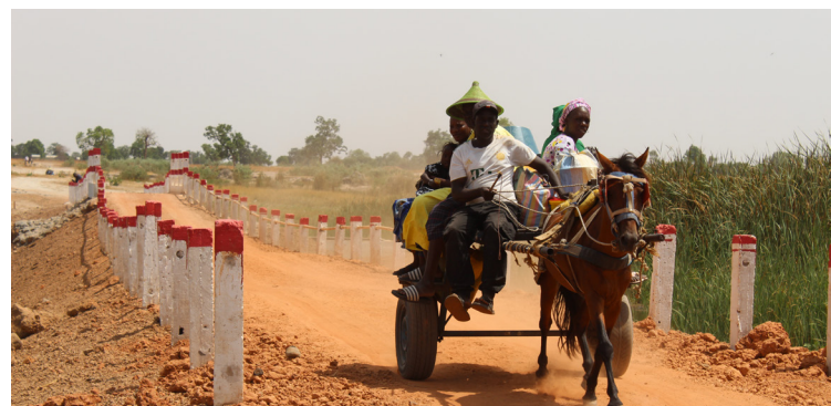
Construction de mini-barrage dans la Vallée de Ndienguène entre les villages de Médina Salam et Koité, Sénégal. Photos prises le 04 mai 2026 avec l'autorisation des personnes y figurant.